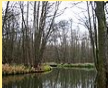
olše lepkavá zpevňování břehů