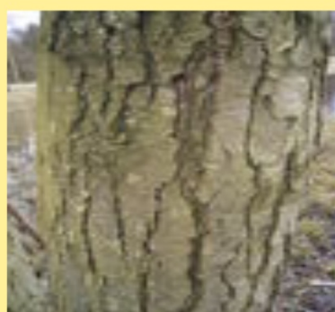
borka vyčinění kůží