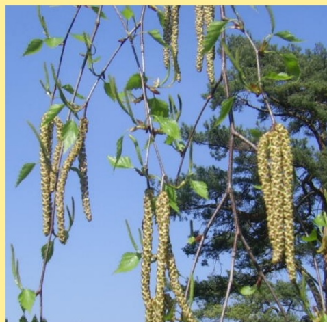
jednopohlavné květy uspořádané v jehnědách