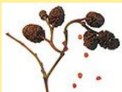
dřevnaté šištice úprava vody v akváriu