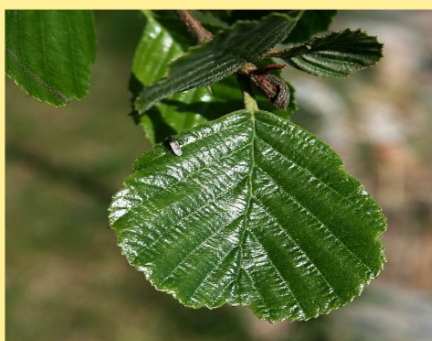
listy nachlazení, horečka