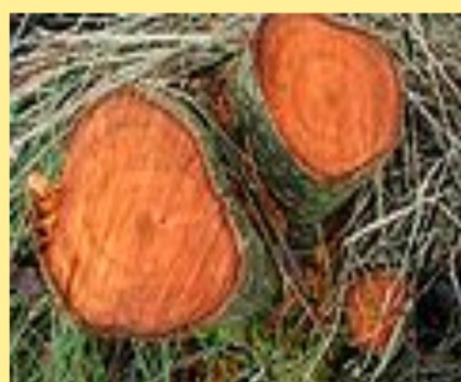
dřevo výroba nábytku