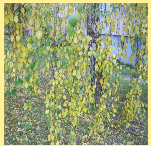
listy břízy bělokoré