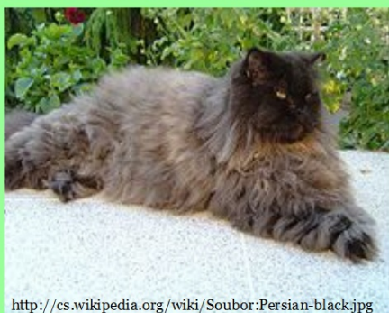
britská kočka perská