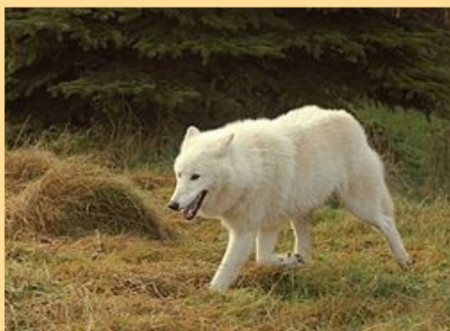
VLK OBECNÝ ARKTICKÝ

Vlci jsou velmi rozmanitým druhem, jejich srst může být čistě bílá, vybarvená v odstínech šedé, ale také úplně černá nebo rezatá, stříbrná či zlatá. Zvláštností je, že vlci mohou během let barvu srsti úplně změnit.