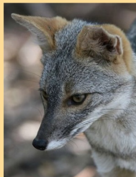
PES POUŠTNÍ příbuzný psovi

http://cs.wikipedia.org/wiki/Soubor: Polarwolf004.jpg