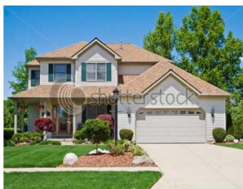
Nákup rodinného domu