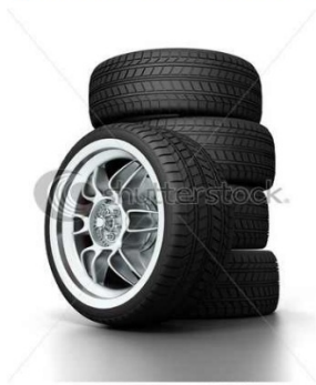
Nákup nových pneumatik