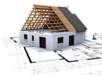
Výstavby rodinného domu