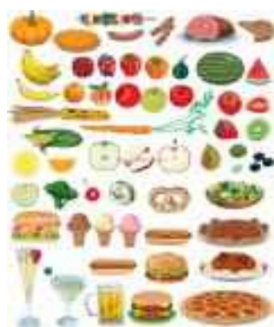
Věci okamžité spotřeby: potraviny, nápoje...