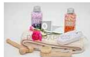
Věci osobní potřeby : oděvy, hygienické potřeby, knihy, hračky...