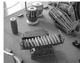
xylofon a tabla