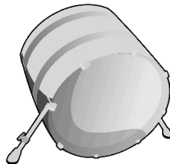
kopák může být i nesen