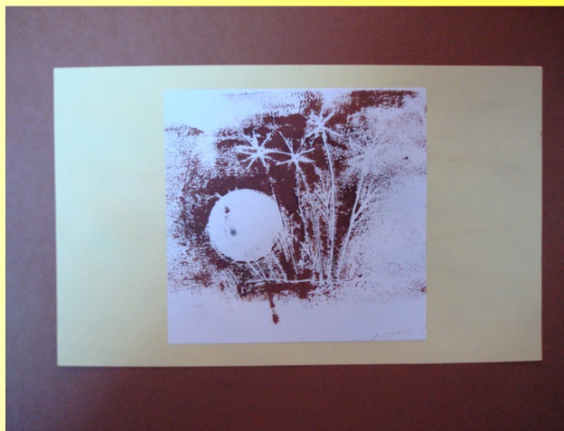
Sádroryt - lze zařadit i do grafické Rytina do sádry a následný "lžičl" Foto - práce autork