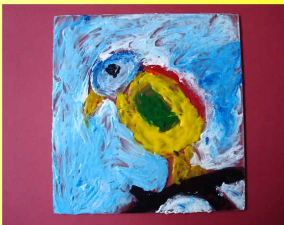
Malba prstovými barvami na sklo foto - práce