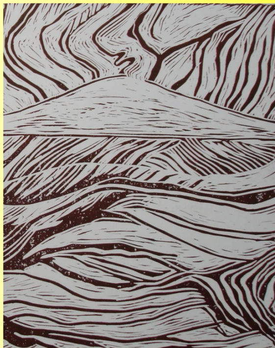
Linoryt - lze zařadit do grafických technik