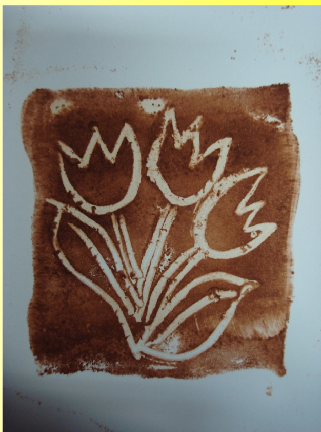
Tisk z plastelínořezu - foto práce a