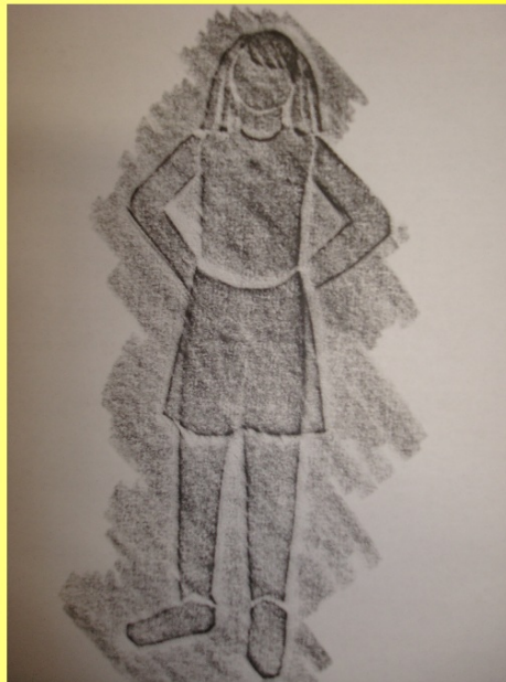
Frotáž papírořezu - foto - práce a