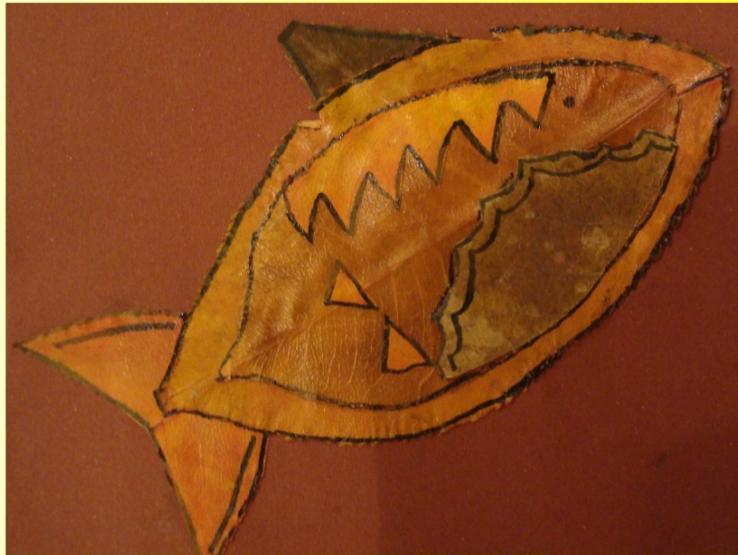
Práce s přírodním materiálem - foto - práce