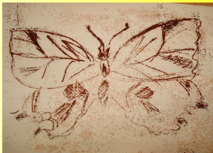
Kresba na smirkovém papíře - kombinovaná technika - foto -