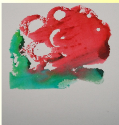
Experiment - kombinovaná technika