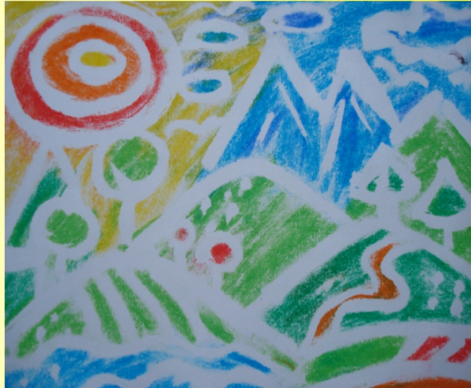
Gumotist - kresba klovatinou a vymývaná kresba suchým pastelem - fo