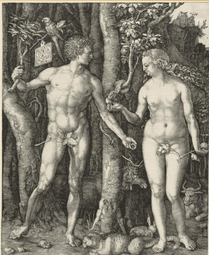
Albrecht Dürer (1471–1521), Adam a Eva, mědiryt 1504 http://cs.wikipedia.org/wiki/Soubor:Adam_Eva,_Durer,_1504.jpg