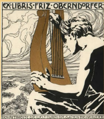
Ex libris majitele Fritze Oberndorfera vytvořené Alfredem Rollerem

Ex libr Doslova znamená - z knih, ve smyslu tato kniha Papírová nálepka formátu A 6 a menší, form motto, slog