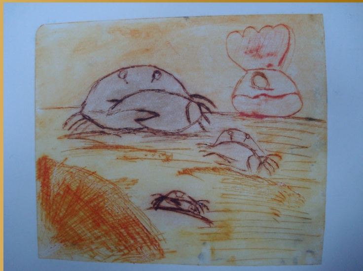
Kresba na fólii - vlastní kresb