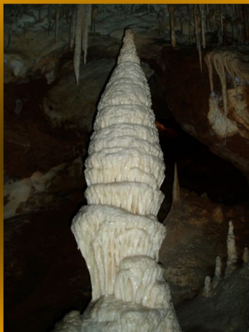
Krápník vyrůstající ze dna jeskyně.