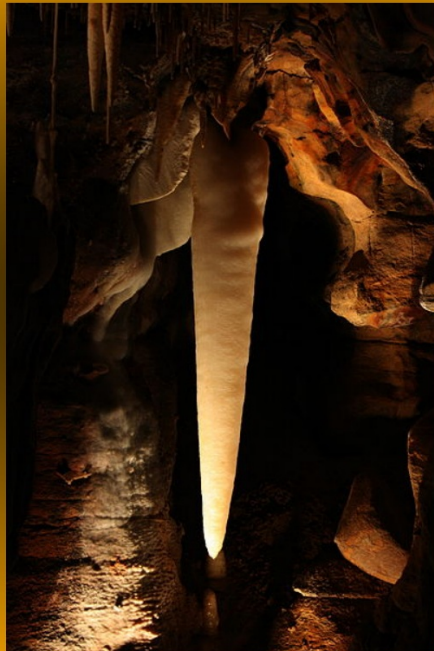
Krápník vyrůstající ze stropu jeskyně.