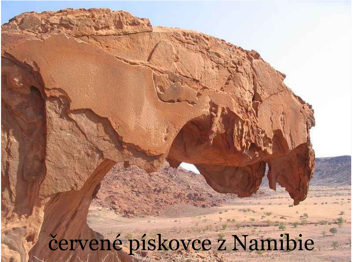
červené pískovce z Namibie