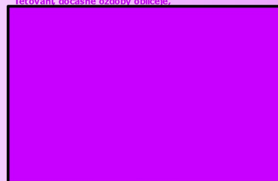
Tetování, dočasné ozdoby obličeje,

Porovnejte hygienu a úpravu zevnějšku v době rokoka a dnes, najděte adekvátní kosmetický úkon v